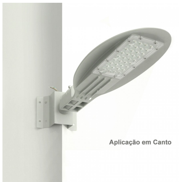
Aplicação em Canto